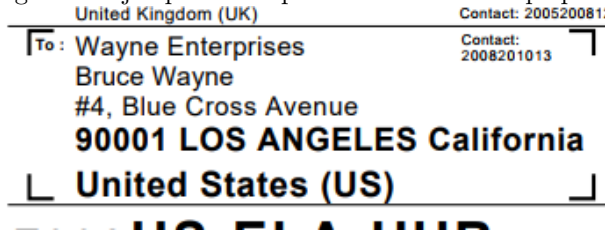
Figura 1: Ejemplo de etiqueta en un sobre de paquetería

1. (20 puntos) Redacte el pseudocódigo del script.